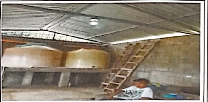
Foto 6: Levantamiento de plancha e instalación de accesorios de tinacos hacia la pila.

Observación: Si es necesario se pueden agregar hojas adicionales y actualizar el número de fotos.