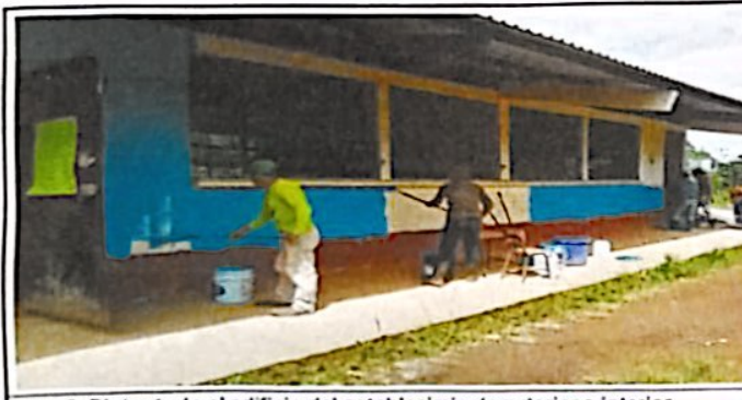
Foto 5: Pintar todo el edificio del establecimiento exterior e interior