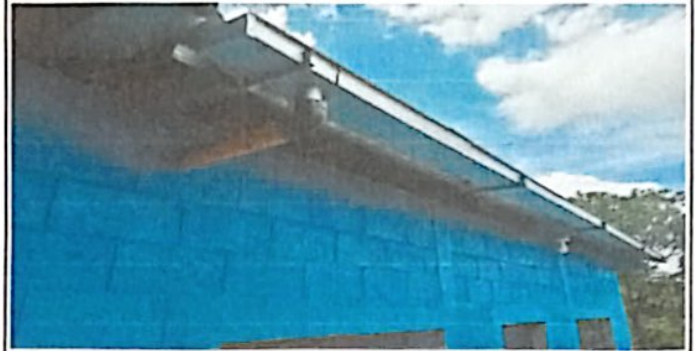
Foto 2 Colocación de canales y tubos para bajada del agua hacia los tinacos