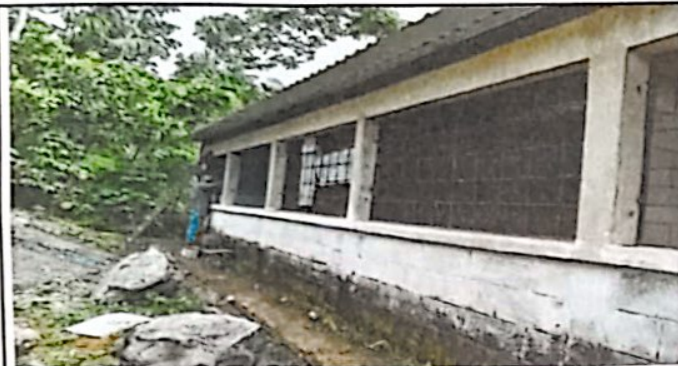
Foto 3: Mejoramiento de tres aulas y direccion del establecimiento.