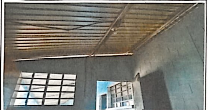
Foto 4: Instalación de sistema eléctrico en dos aulas, dirección y cocina