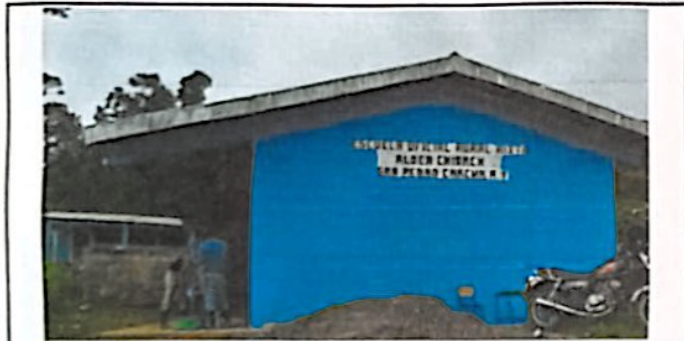
Foto 5: Se pinto todo el edificio del establecimiento al exterior e interior