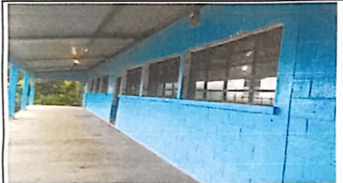
Foto 3: Se instalo ventanas con valcones resistentes de metal y vidrios.