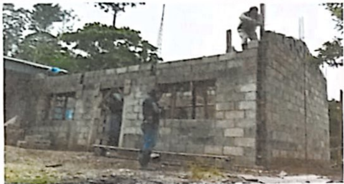
Foto1: Reconstrucción de la cocina escolar.